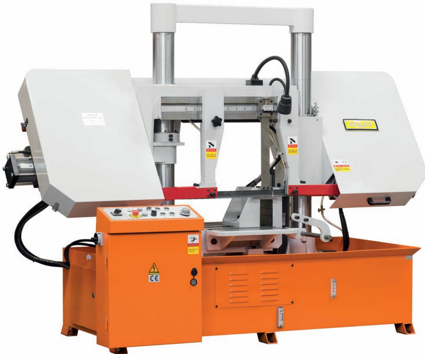
Ленточнопильный станок STALEX TKG-4240

– Если взять, к примеру, системы плазменной резки STALEX, в чем заключаются их технологические особенности?