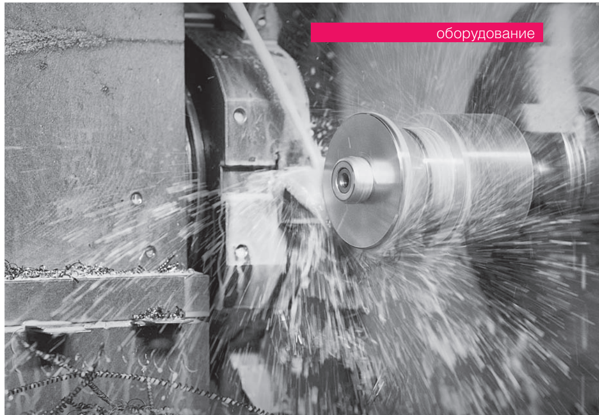
Работа на токарно-винторезном станке STALEX C6140W

– В случае, если клиент не может посетить наши демонстрационные залы в г. Москва и г. Железнодорожный, то станки STALEX представлены в региональных представительствах в 23 крупней-