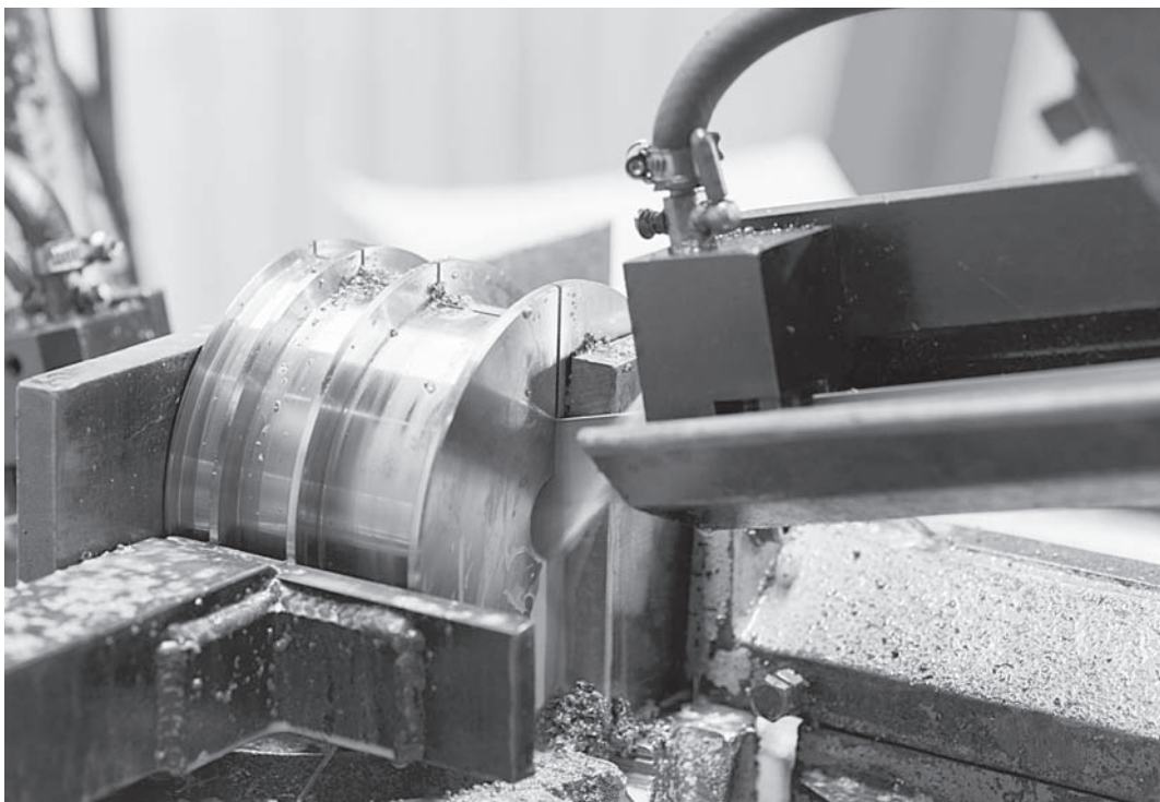
Работа на ленточнопильном станке STALEX TKG-4240