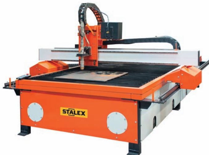
Станок плазменной резки STALEX HPR

– Нам приходится достаточно много внимания уделять этому вопросу. На самом деле не так сложно сделать идеально один станок. А вот когда станки выпускаются серийно, сотнями штук, то очень важно так организовать процесс, чтобы минимизировать любой че-